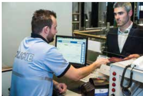
Policista provádějící hraniční kontrolu v systému hraniční kontroly KODOX umožňující elektronickou kontrolu dokladu

Border crossing Praha-Ruzyně at Václav Havel airport Prague