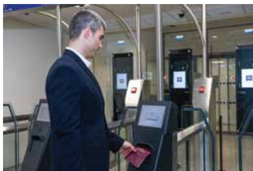
Systém EasyGO EasyGO system

A grant from the Norwegian Fund, within the “Program CZ14 - Schengen Cooperation and Combatting Cross-Border and Organized Crime, including Trafficking and Itinerant Criminal Groups” provided the incentive for modernizing the passport control system, both technical and technological. The project titled “The Enhanced Automated e-Passport Control System at International Airports (e-Gates)” extended the automated biometrical control system EasyGO and outfitted passport control stations with modern passport reading devices supplemented with respective expert systems.