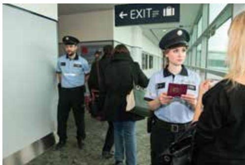
Provádění kontroly pravosti dokladů cestujících u výstupu z letadla Passport authenticity check