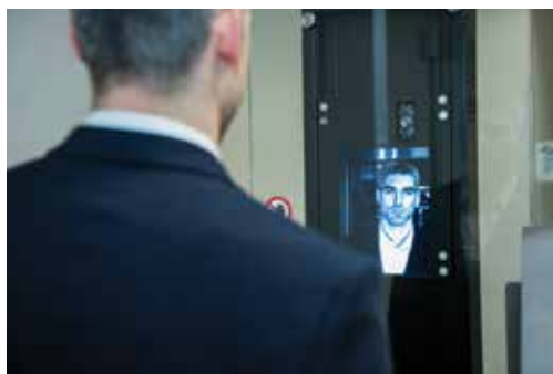
Pořízení obrazu tváře pomocí biometrické kamery Facial image acquisition with a biometrical camera

The information is subsequently cross-referenced against that located in the respective national and international police registers.