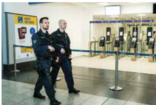
Policisté oddělení mobilního zásahu při ostraze prostor terminálu letiště

With more than 400 police officers, the Alien Police Inspectorate at the Václav Havel International Airport Prague is the largest. The organization is divided into departments and groups, including: the Border Control Department, the Rapid Intervention Department, the Group of Criminal Proceeding, the Department of Territorial Public Order Protection, the Bomb Squad Unit and the Protection of the Special Building Group.