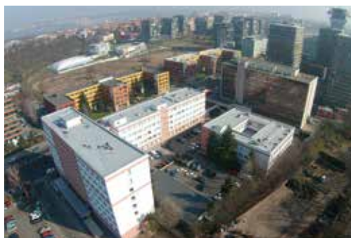
Budova Ředitelství služby cizinecké policie Directorate of Alien Police Service building

Ředitelství služby cizinecké policie je vysoce specializovanou složkou Policie České republiky, která plní úkoly související se vstupem a pobytem cizinců na území. Mezi tyto úkoly patří zejména odhalování nelegální migrace, ochrana vnějších schengenských hranic, řešení trestné činnosti spáchané v souvislosti s překračováním státních hranic a vybrané úkony při povolování pobytu cizinců.