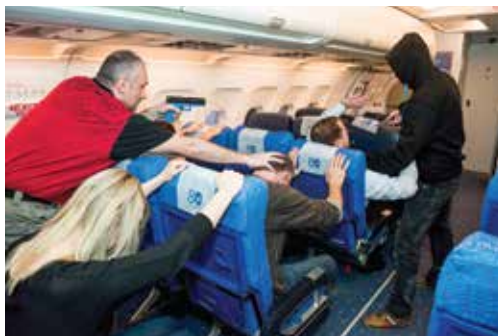
Návčik zásahu policistů oddělení doprovodu letadel Air Marshal Department training