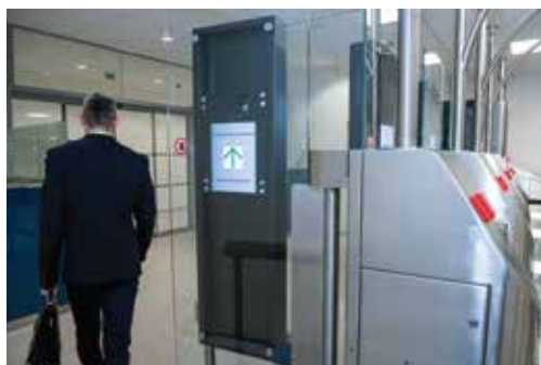
Úspěšné dokončení hraniční kontroly Successful completion of the border control

Provided that all the requirements for the self-service border control are fulfilled, the exit door opens and the system admits another passenger. Ideally, one traveler is checked every 14 seconds.