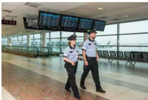
Hlídková činnost na mezinárodním letišti v Praze Patrolling at Václav Havel airport Prague

Executive departments are Alien Police Inspectorates at international airports, the Department of Criminal Investigation, the Alien Detention and Reception Centres, and the Air Marshal Department.