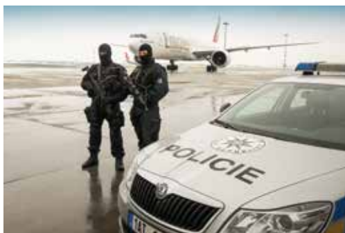
Policisté oddělení mobilního zásahu při ostraze plochy letiště

Police officers of Rapid Intervention Department patrolling airport terminal