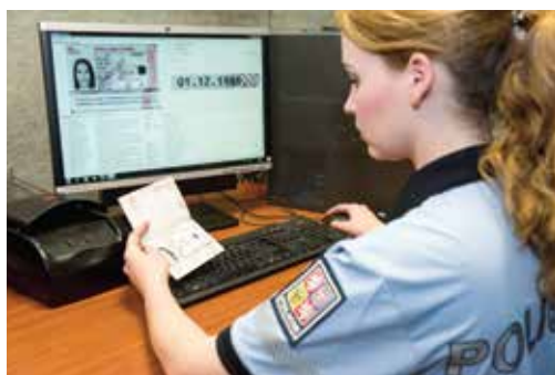
Policistka kontroluje pravost cestovního dokladu prostřednictvím celostránkové čtečky cestovních dokladů expertního optického systému

Police officer performing border check in border information system KODOX