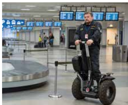
Pyrotechnik na vozítku Segway

Police officers of Rapid Intervention Department patrolling airport apron