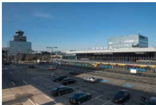
Hraniční přechod Praha Ruzyně na mezinárodním letišti Václava Havla Praha

Největším inspektorátem cizinecké policie je inspektorát na mezinárodním letišti Praha – Ruzyně, na němž vykonává službu více než 400 policistů. Tento inspektorát je členěn na skupiny a oddělení, kterými jsou oddělení vykonávající hraniční kontrolu, oddělení mobilního zásahu, skupina pro trestní řízení, územní oddělení, skupina pyrotechniků nebo skupina ochrany objektů zvláštního významu.